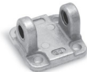
Задняя подвеска охватывающая Мод. C