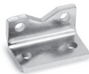
Лапы Мод. B