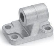
Шарнирное крепление Мод. ZC