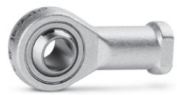
Сферический наконечник Мод. GA*