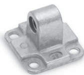
Задняя подвеска охватываемая Мод. L