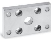
Задний и передний фланец Мод. D-E