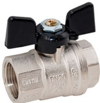
Кран серии 302

Краны шаровые предназначены для простой и быстрой подачи или перекрытия сжатого воздуха, воды и т.д. Выполнены их латуни никелированной, уплотнение шара PTFE. Рабочее давление: до 40 бар (серия 302) и до 16 бар (серия 303). Температура эксплуатации -20...+120°C.