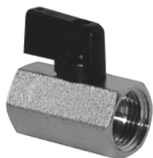
Кран серии 303