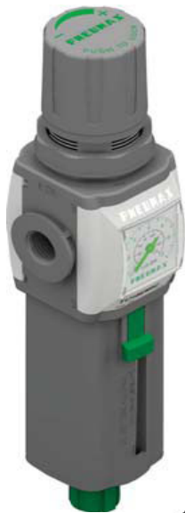
Тип EM и EW