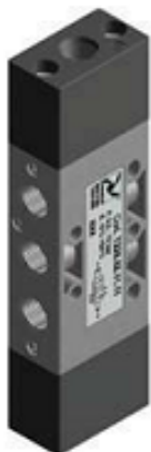
Распределители двухстороннего действия