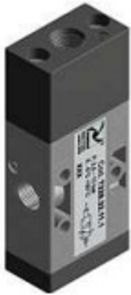
Распределители одностороннего действия