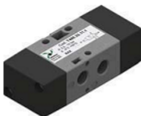
Распределители двухстороннего действия