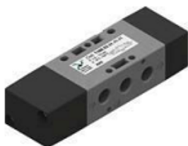
Распределители одностороннего действия