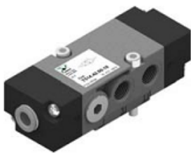
Распределитель NAMUR пневмоуправляемый 4/2НЗ